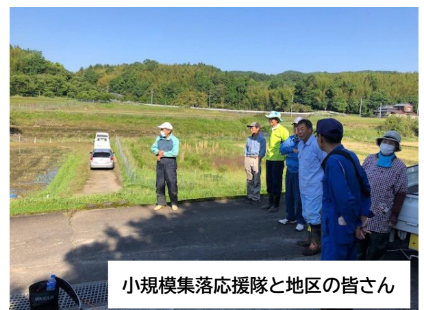
小規模集落応援隊と地区の皆さん