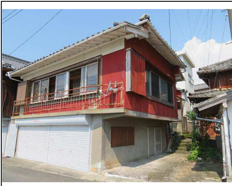
主要施設へのアクセス