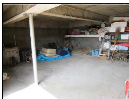
シャッター付き倉庫(1階)