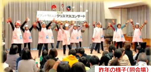
昨年の様子(同会場)